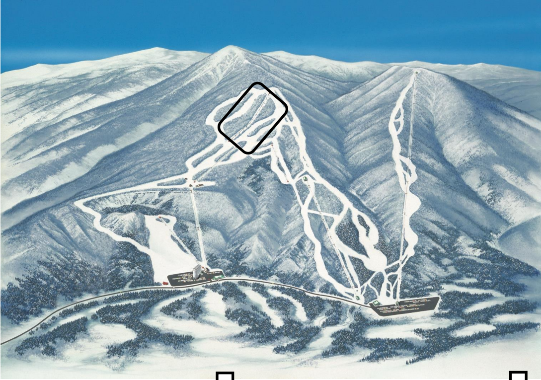
◎ アルパンスキー・スノーボード競技