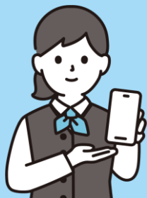
電話リレーサービス