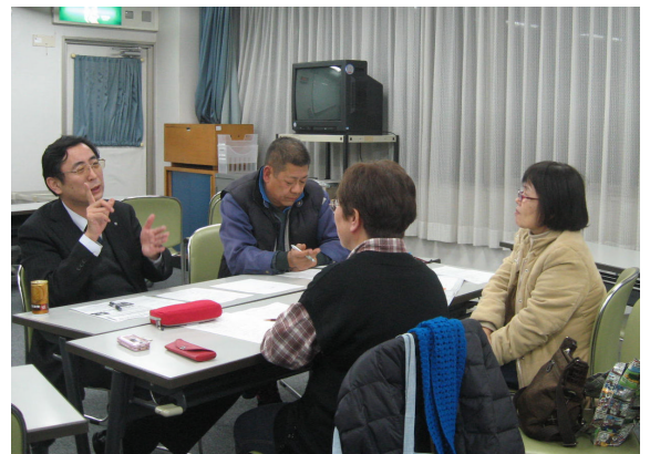
事務局会議：カンパチーム会議の様子