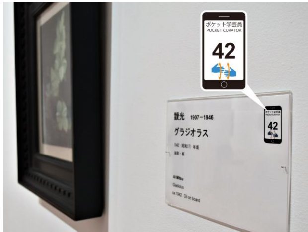
横須賀美術館「手話による作品解説動画あり」の表示