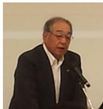
田岡手話市長会長