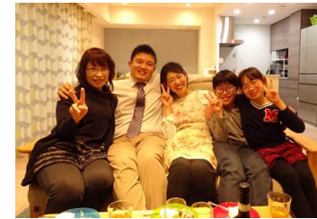
学習動画の出演者