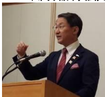
平井伸治鳥取県知事