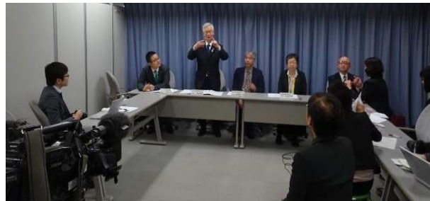
制定後の記者会見の様子

記者からは「条例には手話の環境整備があるが、現状もっと手話が使えようになったら良いと感じていることは？」や「具体的に期待すること」「手話通訳者と通訳士の違いは？」「国の手話言語法」など幅広い質問が寄せられ、手話言語への関心の高さが伺えた。