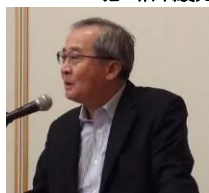
日本財団 尾形武寿理事長