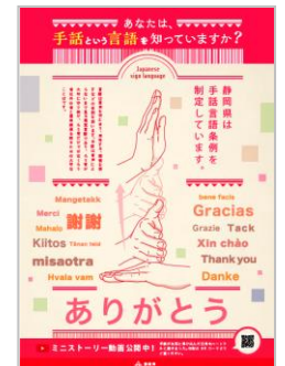
手話言語条例啓発ポスター