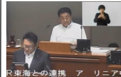
議会議中継の映像

手話言語訳動画は、条例を「日本語」から「手話言語」へと翻訳を行った。ろうの子どもが登場。「もっと、もっと手話が広がりますように」と人々に語りかけるところから始まる。手話の言語力は様々だが、ろう者、手話通訳士・者、手話サークル員、聞こえる学生らが出演している。今年「県民向け手話言語講座」及び県民ひとりひとりが手話であいさつを行うことができることを目指して「手話であいさつを推進運動」で県内のろう者、手話サークル会員を対象に「手話あいさつ推進員」を養成する。2つの事業を合わせて300万円が計上された。