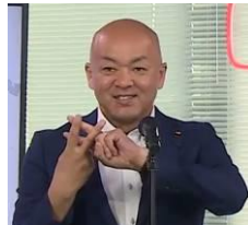
堀井学外務大臣政務官