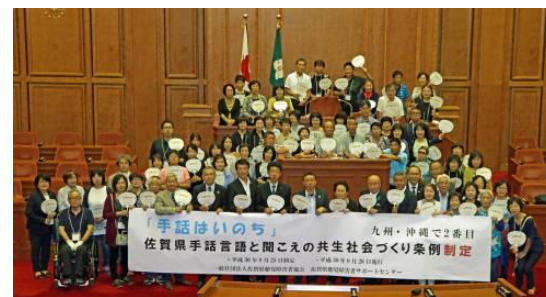
佐賀県議会で記念撮影

条文には、手話言語はろう者が受け継いできた文化的所産であること、学校での理解促進、学習機会の確保、災害時の対応などを盛り込んでいます。9月26日施行です。