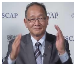
ハム ホンジュ事務局長