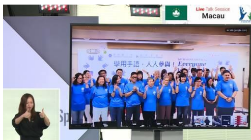
ライブ中継の様子