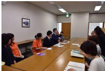
岡崎市との交渉の様子

要望を受けた市長より、「積極的に条例を制定したい」、「前向きに検討していきたい」などの声をいただきました。