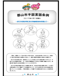
郡山市手話言語条例パンフレット