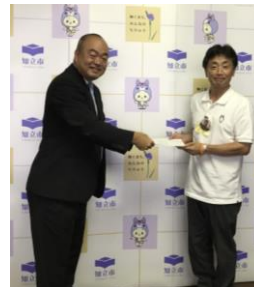
要望書を提出する様子（知立市）