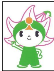
宍粟市マスコットキャラクター しーたん