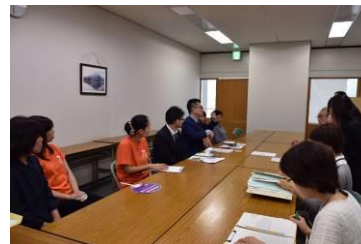
岡崎市との交渉の様子

要望を受けた市長より、「積極的に条例を制定したい」、「前向きに検討していきたい」などの声をいただきました。