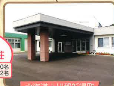
北海道上川郡新得町