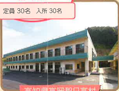
高知県高岡郡日高村