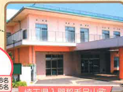
埼玉県入間郡毛呂山町