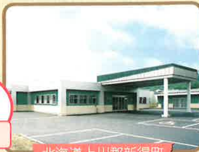
北海道上川郡新得町