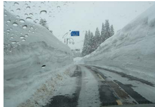
大湯温泉方面へ県道