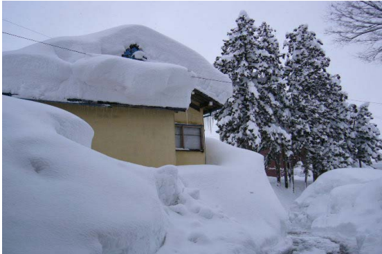
3 m～4 m屋根まで積雪すご～いなあ！