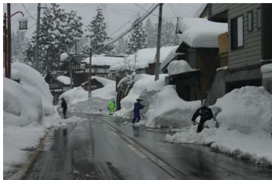
毎日雪ほり、雪下ろし…。がんばるぞ！