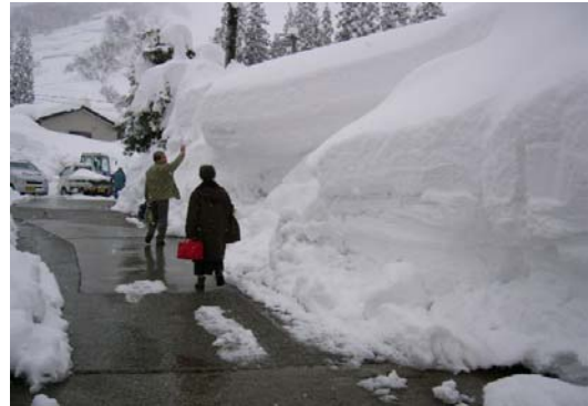
大湯温泉「村上屋旅館」駐車場