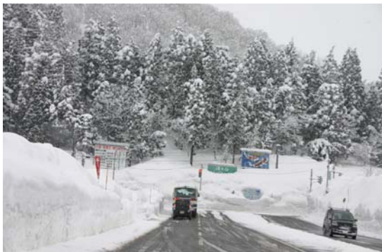
小出 I C 前通り