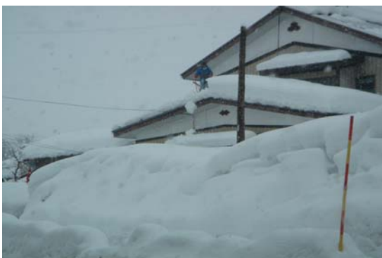
十日町市 民家 雪下ろし