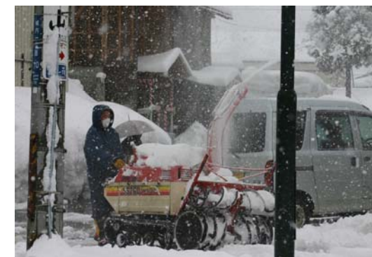
小千谷市 民家 小型除雪車