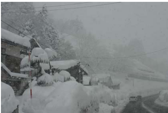
川口町 17号国道 大雪が降る