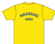
ボランティア・国リハ学生