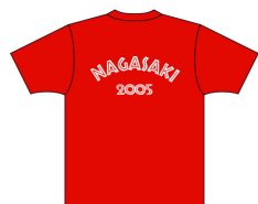
県実行委員・地域実行委員