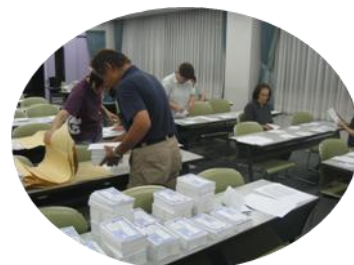
カンパ用紙発送作業中

2回目の期日が9月30日に決まりました。1回目同様、裁判が終わった後、高松センタービルにて、報告集会を開きます。そこで、裁判の様子を報告しますので、仕事のため裁判が傍聴できない方もぜひ、参加お願い致します。なお、詳しい案内は傍聴案内にありますので、目を通してください。