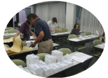
カンパ用紙発送作業中

2回目の期日が9月30日に決まりました。1回目同様、裁判が終わった後、高松センタービルにて、報告集会を開きます。そこで、裁判の様子を報告しますので、仕事のため裁判が傍聴できない方もぜひ、参加お願い致します。なお、詳しい案内は傍聴案内にありますので、目を通してください。