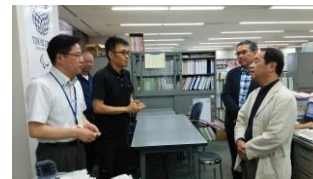
＜熊本県庁 障がい者支援課・社会参加支援班＞

熊本県庁障がい者支援課担当・社会参加支援班担当と意見交換を行いました。その後、被災地障害者センターくまもと等で情報交換を行いました。