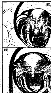
◇1814～78年の『北斎漫画』を再編集し、文

の「漫画」とはそれぞれ描くという意味で、直接に物語を運ぶマンガとは違っている。田舎親父の寄り合い風情、疲れた母親の屋敷顔、風に裾を煽られて困る娘の後ろ姿など、当時美存したくない人となりのあらゆるリアリティを一閃の中に完璧に閉じ込めてある。この「漫画」は、その中に閉じ込めてある「まじまじの手」が、けいはい、さながら生きてはたらくかぞおほゆる、と江戸の狂歌師・六樹園(石川雅望)が序文で褒める通り、今日目にも、人間の気配、交わる姿はきびきびと生動する。ゆるく分類され、ページにきびきびと描き込まれた略筆の人物図には、無数の小さな物語が宿っているように感じる。ページの上を流れる目は、ある人物の仕事や止まり、逆行し、なぞるように跳め直す運動を繰り返している。読書の感覚にまよっている。 『北斎漫画』は、日本の書物としてもっとも早い時期に欧州へ渡り、紹介されている(シムポルトの『日本』、一八三三年刊)。ジャポニズムの起爆剤としてフルに働いた、「世界文学」でもある。