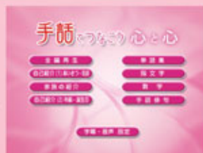
▲DISC1のメインメニュー画面

DVDをご使用されるプレーヤーの手順に従ってスタートさせると、自動的にメインメニューが表示されます。メニューの中にはすべてを見る[全編再生]や講師の解説によって手話を学ぶ[基本会話]、更に例文を発展させた[応用会話]他、[単語集]、[指文字]、[数字]などがあります。一通り見終わったあと、もう一度見たい項目へ直接移動することができます。特に指文字や数字は手話の基本です。スムーズに取り取り、表現できるようになるまで、繰り返し練習してください。